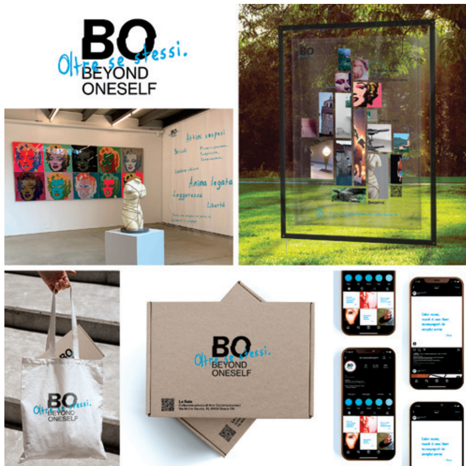
Giulia Grillo - Progetto di Tesi individuale in collaborazione con Collezione La Gaia