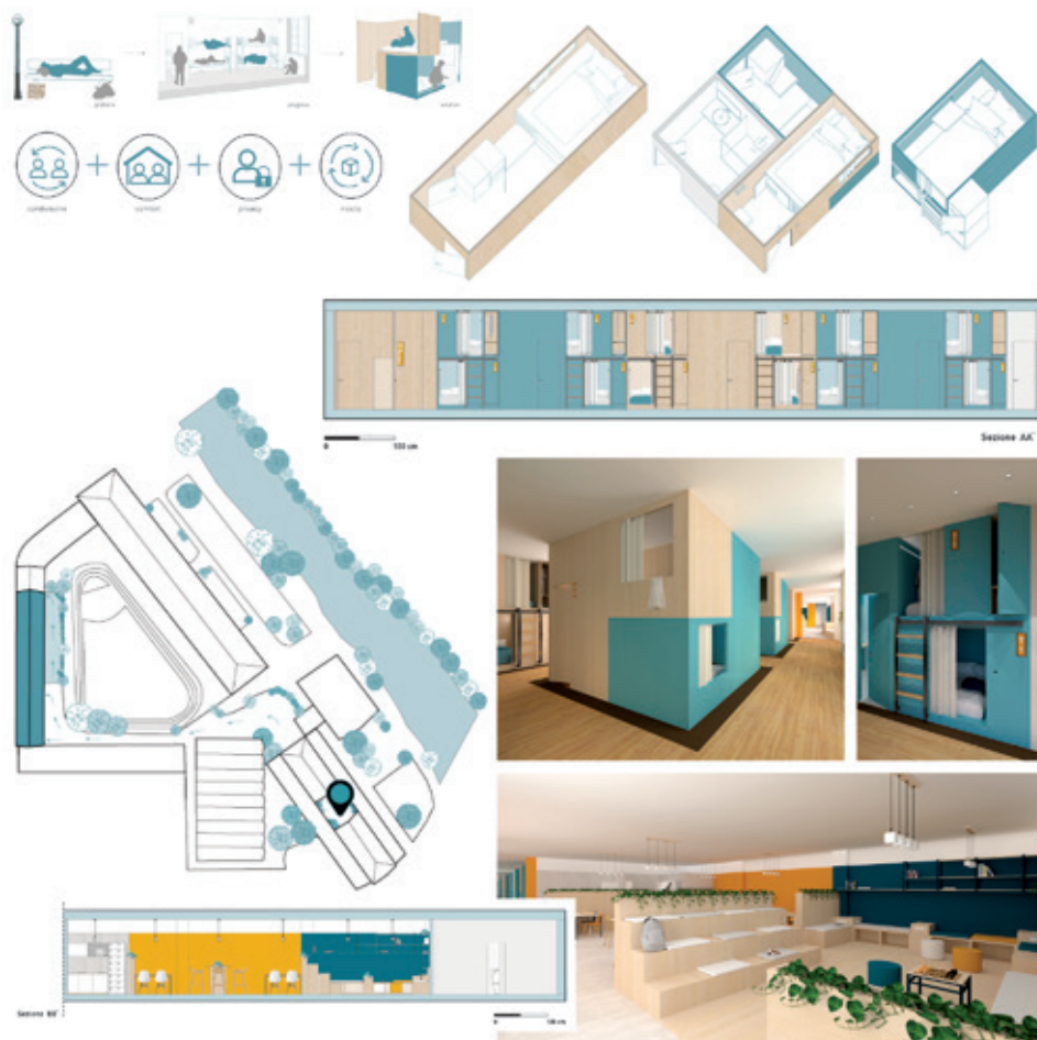
Federico Botta - Progetto di Tesi individuale in collaborazione con Serming