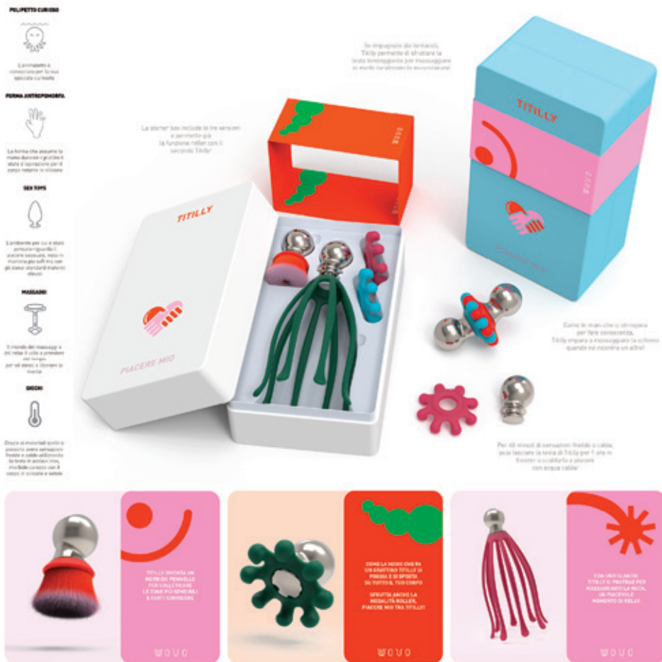
Matteo Parisi - Progetto di Tesi individuale in collaborazione con Wovo