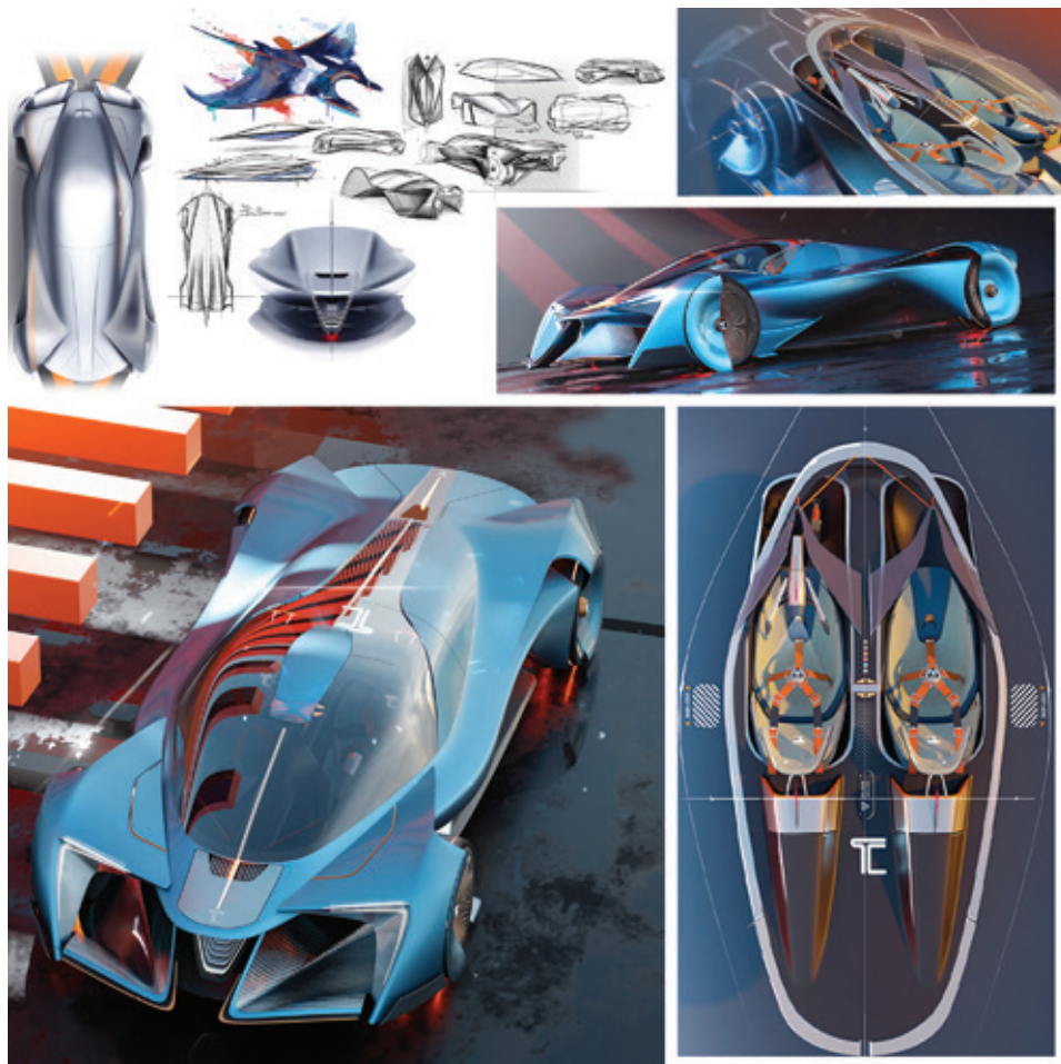
Davide Bianco Francesetti - Progetto di Tesi individuale in collaborazione con Tecnocad